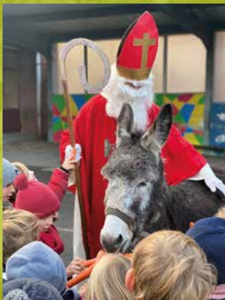
Chaque année, l'Apel organise la venue de saint Nicolas en Maternelle.

L'association sera heureuse de vous accueillir et de vous compter parmi son équipe de parents bénévoles.