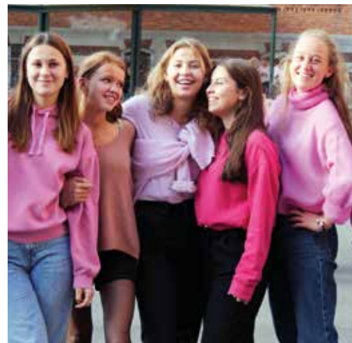
Les lycéens du club Interact de la Croix Blanche ont organisé une action de sensibilisation sur le cancer du sein en octobre 2022.

Le club Interact réunit les lycéens volontaires qui souhaitent imaginer et mettre en œuvre des actions citoyennes , tournées vers la vie de l'établissement, la collectivité locale ou le rapprochement entre les cultures. Cette proposition concrétise le souhait de l'établissement d'encourager les jeunes à s'engager, tout en bénéficiant d'un cadre associatif dynamique et adapté qu'est celui du Rotary.